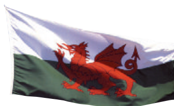
Le dragon rouge veille sur le Pays de Galles.

Donc plus d'hésitation, direction le Pays de Galles pour les prochaines vacances. Et si vous souhaitez quelques renseignements complémentaires ou quelques astuces pour la « logistique », le jumelage Gouesnou-Brecon est à votre service.