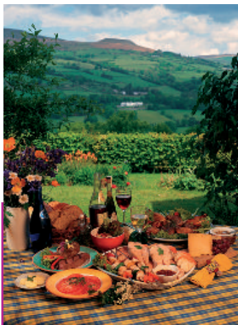
Le Pays de Galles : découvrez ses superbes paysages et laissez-vous surprendre par sa gastronomie.