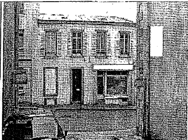
Photo de l'immeuble