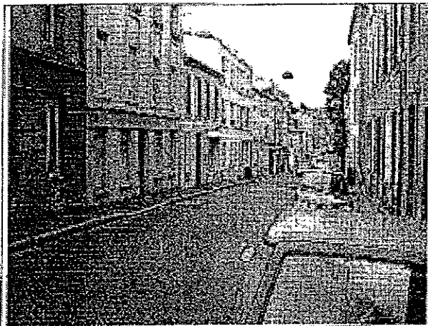
Photo de la rue